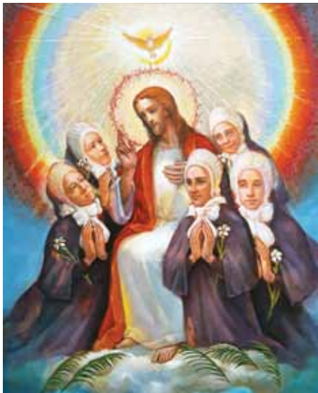
Zavjetna slika u kapelici u Novom Travniku; autor Anto Mamuša, 2021.

Kao dio Tijela poslani smo govoriti i drugima svjedočiti ono što smo mi iskusili i možemo iskusiti sve dok ne dođemo u Kraljevstvo. Tako su živjeli mučenici, tako su živjele