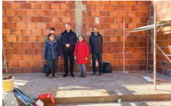
Crkva u Goraždu u izgradnji

U kapeli sv. Dominika u Goraždu slavili smo svetu misu, obišli smo crkvu u izgradnji i pomolili se kod spomen-obilježja. U Pale smo se vraćali putem kojim su sestre mučenice dovedene u Goražde. Putovali smo preko planine Hranjen i kroz Hrenovicu došli u Praču gdje se nalazi katoličko groblje zajedno s pravoslavnim. U Prači nema više katolika, zadnja žena katolkinja sahranjena je 1942. godine. Nakon