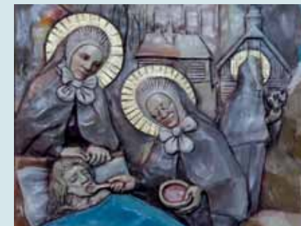
Benedikt XVI., Deus caritas est (Bog je ljubav), br. 18.

Sveci su sposobnost da ljube bližnjega na uvijek nov način crpili iz svoga susreta s Gospodinom u euharistiji i, obratno, taj je susret zadobio svoj konkretan oblik i svoju dubinu upravo u služenju drugima. Ljubav prema Bogu i ljubav prema bližnjemu nerazdvojive su; tvore jednu te istu zapovijed. Ali obje se te stvarnosti napajaju na živom izvoru ljubavi Boga koji nas je prvi ljubio. Tako nije više riječ o izvana nametnutoj „zapovijedi“ koja nam nalaže nešto što je izvan naše moći, već radije o iskustvu ljubavi koja se slobodno i iz dubine srca daje, o ljubavi koja se, po svojoj naravi, mora dalje dijeliti s drugima. Ljubav raste po ljubavi.