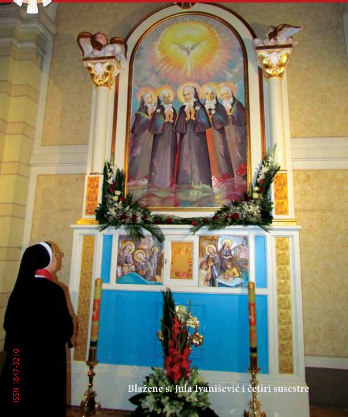
Blažene s. Jula Ivanišević i četiri susestre