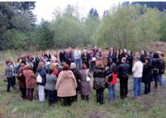
Na Palama, na mjestu nekadašnjeg samostana

No zbog toga su nam blažene Mučenice još dragocjenije i njihovo svjedočanstvo je iznimno važno: ne samo da se svetost može postići unutar zajednice, nego je može postići čitava zajednica , a ne samo pojedinci. Obično težinu i poteškoće života u zajednici promatramo kao teret i muku, a ako imamo vjeru onda i kao križ koji nas može približiti Bogu.