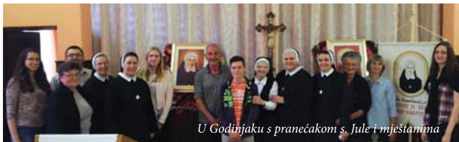
U Godinjaku s pranećakom s. Jule i mještanima