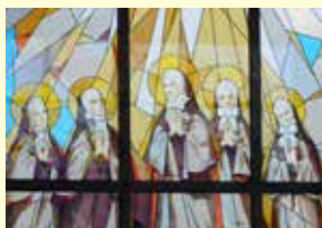
Vitraj u crkvi u Novom Travniku