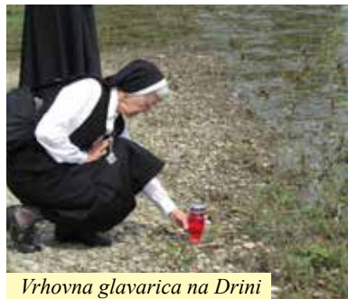
Vrhovna glavarica na Drini