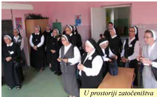
U prostoriji zatočeništva