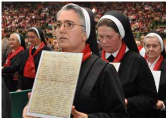
Na beatifikaciji u Sarajevu 2011.

kilometra. “ Išla sam po potpunom mraku cestom uz rijeku koja je šumila. Bojala sam se da se ne strovalim u rijeku. Došavši u crkvu, predstavila sam se svećeniku i zamolila za smještaj. On je odmah svojim suradnicima rekao da mi dadnu večeru i sobu, te da me sutradan odvezu u Šmarjetu, pa u Novo Mesto na kolodvor. Zar to nije čudesno djelo Drinskih mučenica?!