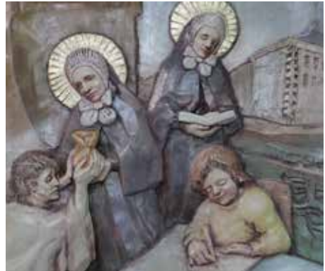
Detalj reljefa Blaženica u crkvi Kraljice sv. krunice, Sarajevo

U svim ovim dramama Bog nije daleko, i jer smo iskusili to u svom životu pozvani smo i mi biti blizu: uputiti riječ koja ozdravlja, darovati zagrljaj koji daje osjećaj razumijevanja, iskazati nježnost koja daje osjetiti ljubav, uputiti molitvu koja