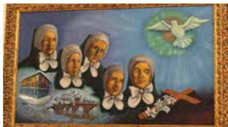
Slika Blaženica u crkvi u Šmarjeti

govore da nije rješenje u ogradama i granicama. Treba ići preko granica, kako nacionalnih, tako i vjerskih i kulturnih. One su bile navjesticeljice Isusa Krista svim ljudima i svim krajevima u kojima su živjele i djelovale, a danas su glasnice cijelom svijetu. Pokazuju nam kako možemo nadići