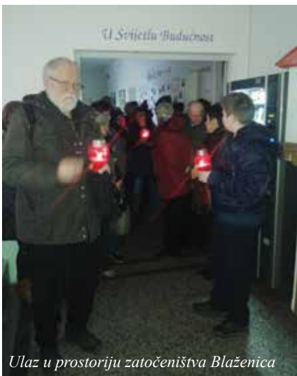
Ulaz u prostoriju zatočeništva Blaženica

„Oni dođoše iz nevolje velike i oprae haljine svoje i ubijeliše ih u krvi Jaganjčevoj“ (Otk 7,13).