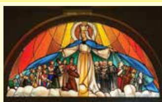
Vitraj u crkvi u Udbini