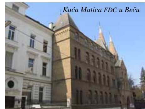
Kuća Matica FDC u Beču