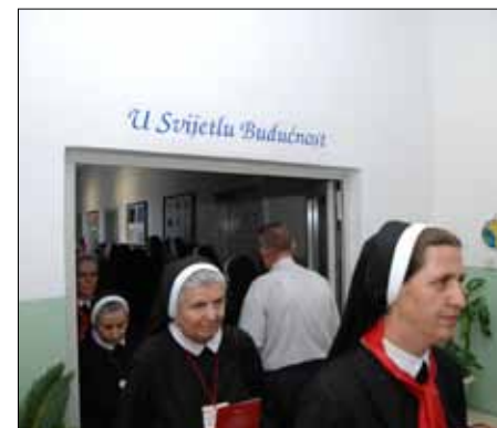
Vrata u nekadašnjoj vojarni u Goraždu, koja vode u prostoriju zatočeništva Blaženica

Stoga tih pet sestara, istinskih kćeri Božje ljubavi, čine ne jedna, nego petera vrata. Kroz njih ulazimo u prostor nade i u život ljubavi i zajedništva s Bogom. I kada nam sâm Isus pokuca na vrata, otvorimo ih širom i pogledajmo uokolo, da vidimo onoga tko stoji pokraj nas, kako bismo i mi mogli postati vrata vjere za blišnjega.