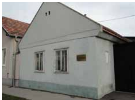
Spomen-ploča je svečano otkrivena 15. prosinca 2011.

Iz Beča se kratkom porukom javila s. Magna Andre te nas izvijestila o postavljanju spomen-ploče na rodnu kuću blažene s. Berchmane. Između ostaloga piše: „Rado se sjećamo vašega posjeta rodnoj župi Blaženice u Enzersdorfu u prosincu 2010. godine. Još uvijek smo pod dojmom predivne proslave beatifikacije u Sarajevu. U studenom smo u župi slavili svečano euharistijsko slavlje povodom beatifikacije. Za vrijeme svete mise, na