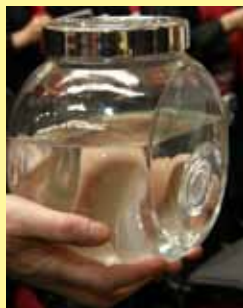
Voda iz Drine