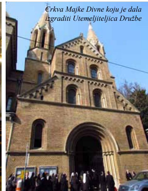
Crkva Majke Divne koju je dala izgraditi Utemeljiteljica Družbe