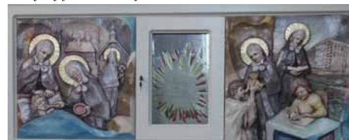
Detalj reljefa u crkvi Kraljice sv. krunice

„Braćo, ako već treba da s velikom pobožnošću slavimo nebeski rođendan svih svetih mučenika, pogotovo nam valja sa svim štovanjem svetkovati blagdan onih, koji su u našim mjestima svoju krv prolili. Jer mučenik, kad trpi, ne trpi samo za sebe nego i za sugrađane. Za sebe naime trpi radi nagrade, a za sugrađane radi primjera; za sebe trpi radi pokoja, za sugrađane radi spasenja. Blaženi dakle mučenici niti su za sebe živjeli, niti su za sebe umrli. Nama su, naime, dobrim životom ostavili primjer vladanja, a hrabrim podnošenjem muka primjer trpljenja. Zato je Gospodin htio da po svem svijetu na različitim mjestima trpe mučenici, da nas kao prikladni svjedoci, kao po nekoj nazočnosti vjere, primjerom svoje ispovijesti oduševljavaju; da ljudska slabost, koja uslijed duljeg slušanja jedva već vjeruje Gospodnjem propovijedanju, bar po neposrednom svjedočanstvu očiju uzvjeruje mučeništvu svetih.“