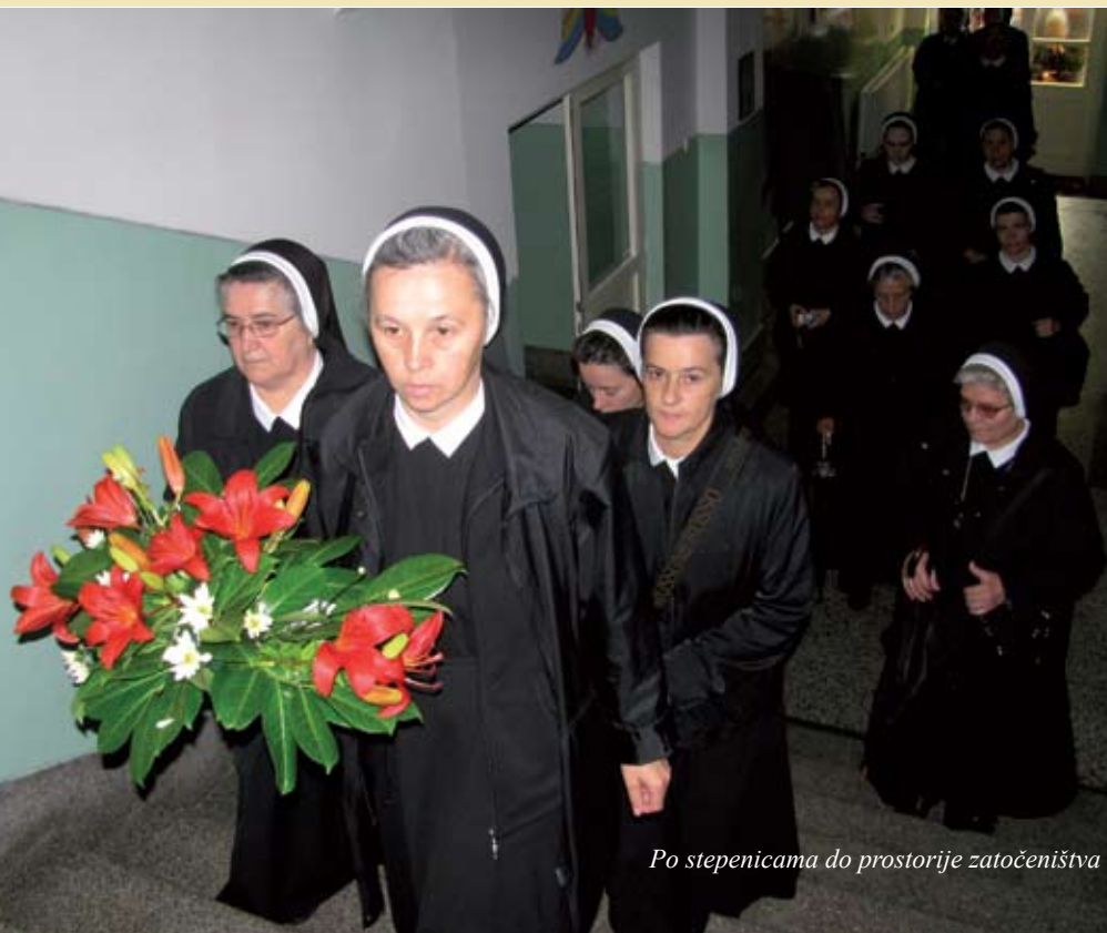
Po stepenicama do prostorije zatočeništva