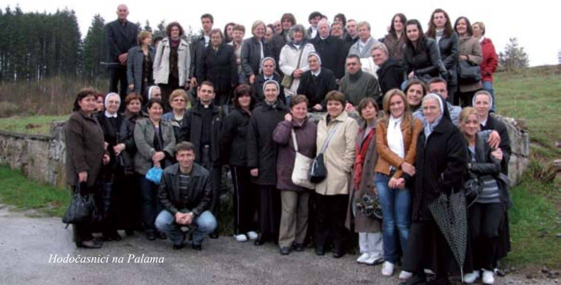
Hodočasnici na Palama